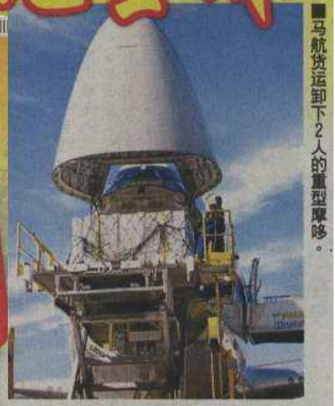
■马航货运卸下2人的重型摩哆。