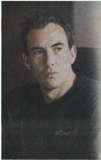
■保罗父亲正患病中，但也支持他完成旅程。