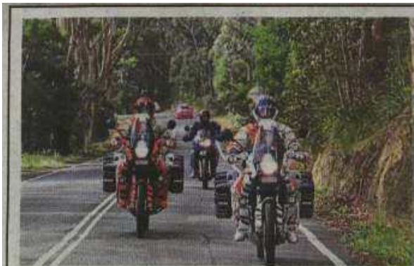
■首日在澳洲悉尼的环球之旅。