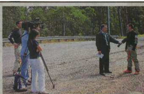
■队伍途经布里斯班时，接受当地媒体采访。