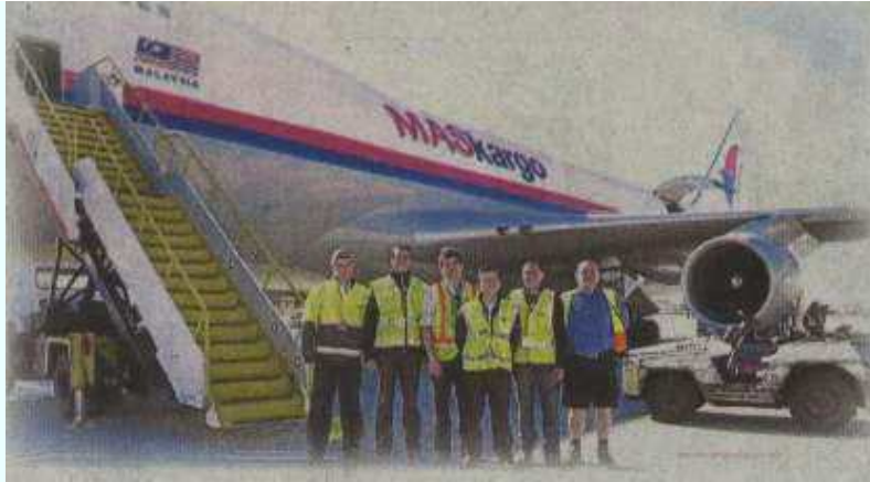
后，与马航工作人员会合。 ■环球之旅队员抵达吉隆坡

为社会公益不留余力的马来西亚航空，也成为环球之旅主要赞助单位，冀为慢性肾脏病患出一分力。